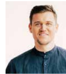
Andreas Kuffner Coach, Speaker & Olympiasieger im Deutschen Ruder Achter 2012

3 Tagungsprogramm: 16. BVDK-Kooperationsgipfel im Pharmamarkt / 4 Editorial: Antrieb Zukunft: Für das Morgen ist das Heute entscheidend / 5 Das innere und äußere High Performance Team – So machen wir unser Boot schneller / Zukunft ist möglich – gerade jetzt! / 6 Pharmalogistik: Wohin geht die Reise? / 7 BEST IN SPORTS: INTERSPORT-Verband auf Zukunfts- und Wachstumskurs / 8 Impressionen 2023: Gute Stimmung in schwierigen Zeiten / 10 Smartes Marketing mit künstlicher Intelligenz / KI – was kommt auf die Healthcare- und Pharmabranche zu? / 11 Potentiale von PoC-Tests als erweiterte pDL in Verbindung mit einem telemedizinischen Angebot: Talk mit G. Kreutner, T. Buck, Prof. Dr. U. May und Dr. D. Heinrich / 12 Der Shopper im Mittelpunkt – Erfolgreich mit Category Management / 13 Der BVDK-Vorstand / 14 Komm auf den Punkt: Wie Daten, Emotionen und KI den Healthcare-Vertrieb transformieren / „Storytelling, das verbindet und verkauft.“ Wie Sie Menschen mit Faszination statt Fakten für sich gewinnen. Jetzt auf (KI)nopfdruk / 15 Ausblick: Anmeldung zum BVDK-Kooperationsgipfel 2024